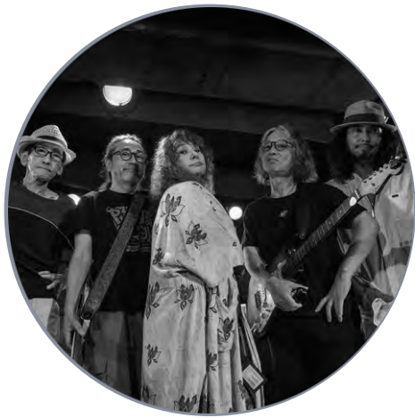
カルメン・マキ デラシネバンド